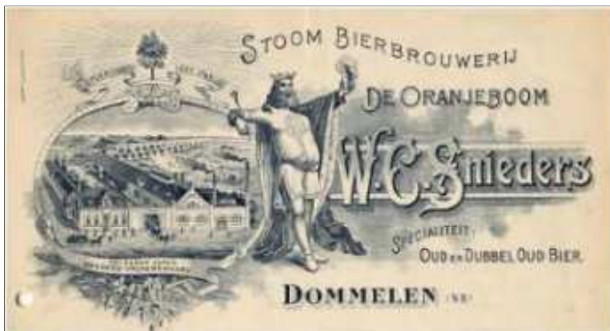
Briefhoofd circa 1900